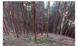
作業完了後の林内

急峻な斜面もある場所でしたが、安全第一で作業を進め、無事完了いたしました。参加された皆さまお疲れ様でした。