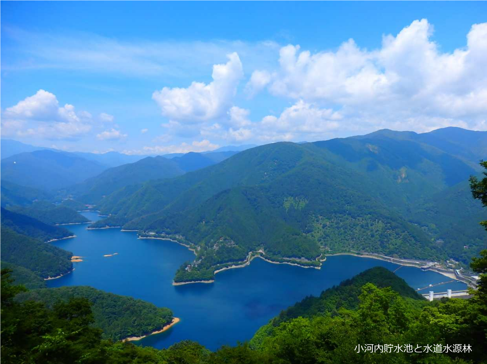
小河内貯水池と水道水源林