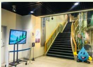
水道施設の電子看板広報