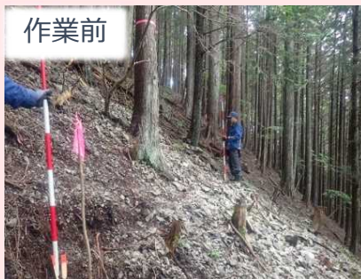
作業前 ころびいし 転石地区 作業の様子