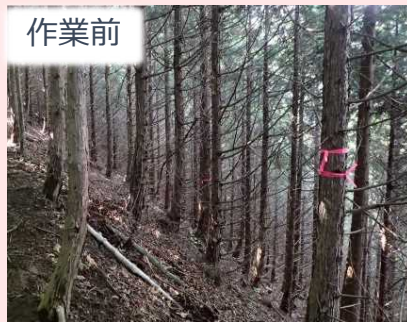
作業前 おおくぼ 大久保地区 作業の様子

余分な枝などを切り落とす、枝打作業を行いました！ 森林内を明るくし、草木の成長を促します。