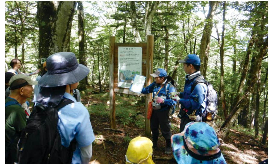
水源林ツアーの様子

なお、各取組を推進するに当たっては、「水道水源林管理計画」に掲げた施策との連携や、都や局をはじめとした、各種関連計画との整合を図っていきます。