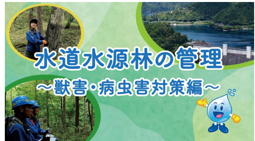
動画による情報発信

多くの方々に「東京水のふるさと」である水源林の魅力を分かりやすく伝えるため「水道水源林ポータルサイト みずふる」を令和4年3月に開設しました。サイト内には水源林の散策動画などがあり、水源林に関する様々な情報を分かりやすく発信しています。