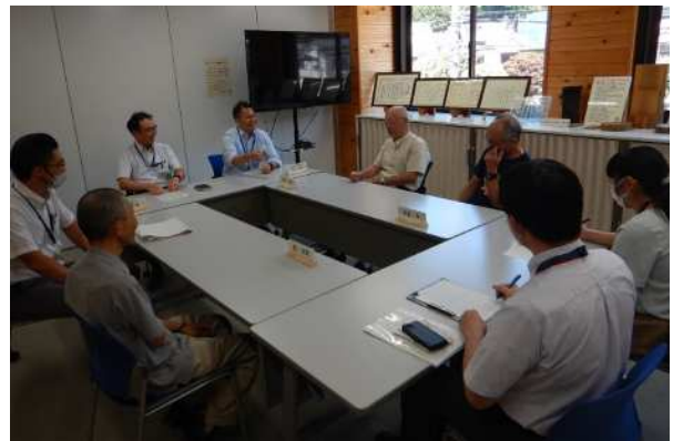
表彰者の方々と歓談しました！ 皆さん、活動への熱い思いを語っていただきました。