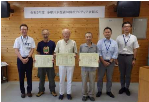
記念撮影！ みなさん笑顔ですね

森林隊では、積極的に参加していただいた隊員の方に感謝を示すため表彰を行っています。表彰式は7月25日（火）に行い、100回及び300回参加を達成された3名の方に、谷口水源管理事務所長及び川植技術課長から感謝状と記念品を贈呈しました。