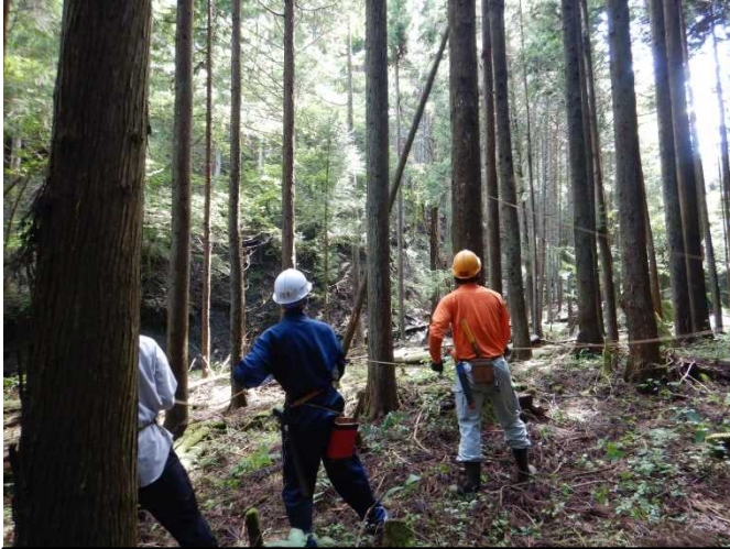
ロープを使って安全に、力を合わせて引き倒します

初めての作業でしたが、今回の活動を通じて、森林保全の大変さや大切さを実感してくれたと思います。