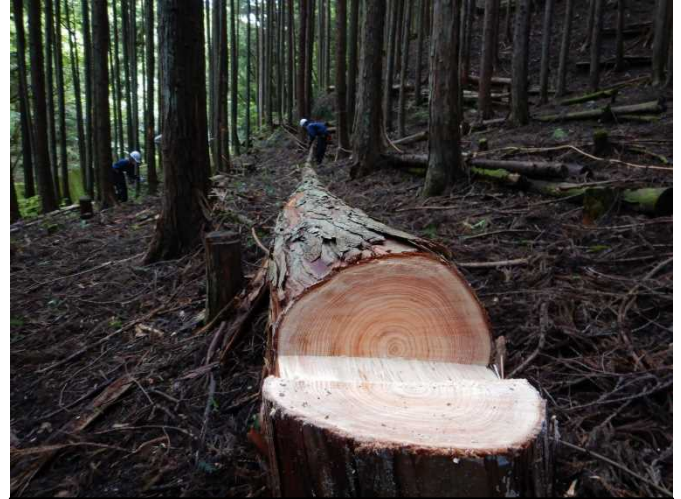
上手に倒せました♪片付け方も丁寧でした！