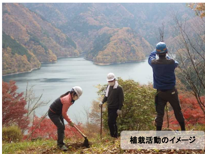
植栽活動のイメージ