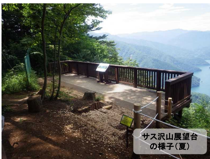
サス沢山展望台の様子(夏)