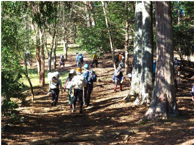
植栽地まで片道20分程度苗木の運搬をしました。

12月4日（日）、8日（木）、10日（土）で、植栽活動とサス沢山展望台見学を行いました。ベテラン、初心者と多くの方に参加していただきました。3日間とも天候に恵まれ、暖かい気温の中、落ち着いて活動することができました。午前には、運搬したツツジ類やヤマザクラの植栽を協力して行いました。