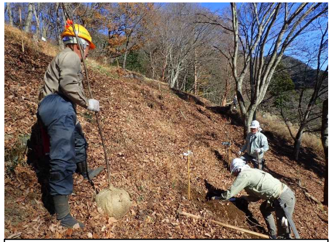
指導員の指示に従って、丁寧に植え付けました。