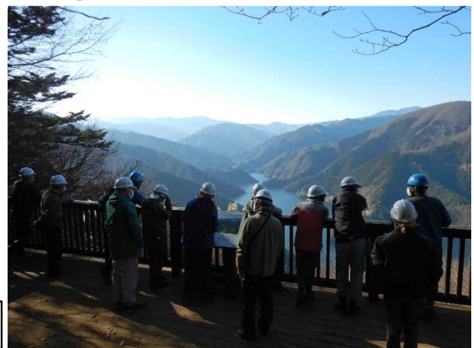
展望台見学の様子。 午前の活動場所も良く見えました。⇒

午後は、サス沢山展望台の見学を行いました。展望台からは主要な山々が見えており、多摩川上流域の森林の広がりについて体感していただくとともに、森と貯水池のつながりについて、改めて理解を深めていただきました。