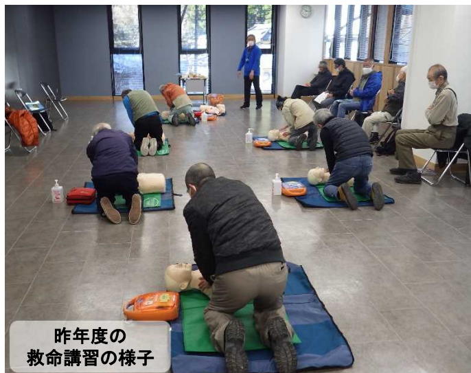
昨年度の 救命講習の様子

また、午後は、事前に撮影した枝打作業の動画を使用して、良い点や改善点について意見交換を行います！ 枝打の経験が浅い方にこそ参加していただきたい と思いますので、積極的な御参加お待ちしております。