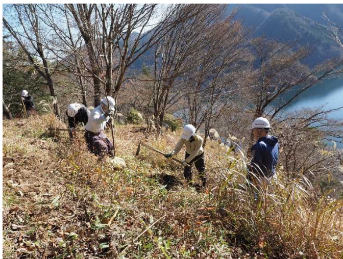
参加者が協力して、大小の苗木を植え付けました。