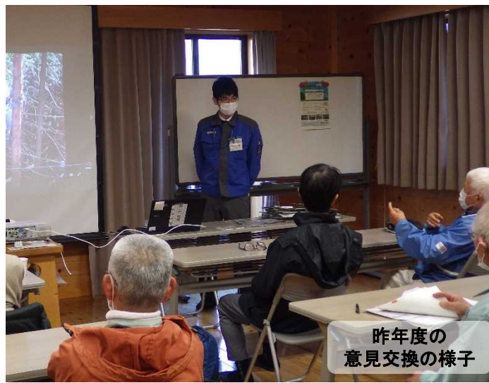
昨年度の 意見交換の様子