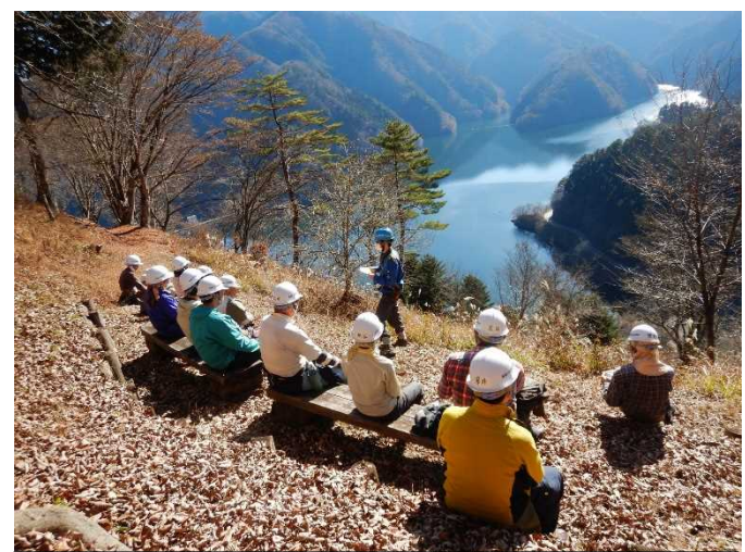
小河内貯水池を見ながらの休憩です。

今回植栽を行った水源地ふれあいのみち小河内ゾーンは、水道水源林と小河内貯水池（奥多摩湖）の役割が分かる気軽なハイキングコースとして整備されているものです。