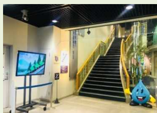
水道施設の電子看板広報