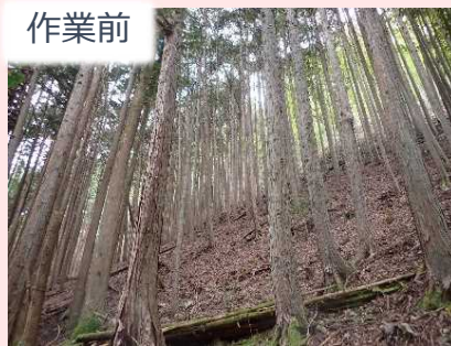
すがだいら 菅平地区 作業の様子

過密になった森林で 間伐作業を行いました！ 森林内を明るくすること で残った木や地表面の草木 が成長しやすくなります。