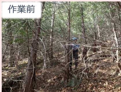
ひうちいし 火打石地区 作業の様子

余分な枝などを切り落とす、 枝打作業を行いました！ 森林内を明るくし、草木 の成長を促します。