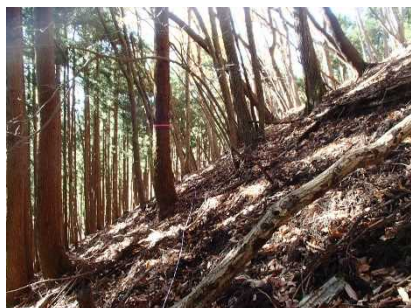
整備前の森林 (購入直後)