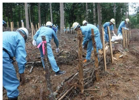
参画企業の森林保全活動