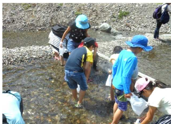
多摩川水系上下流交流会 (川でのマスつかみ)