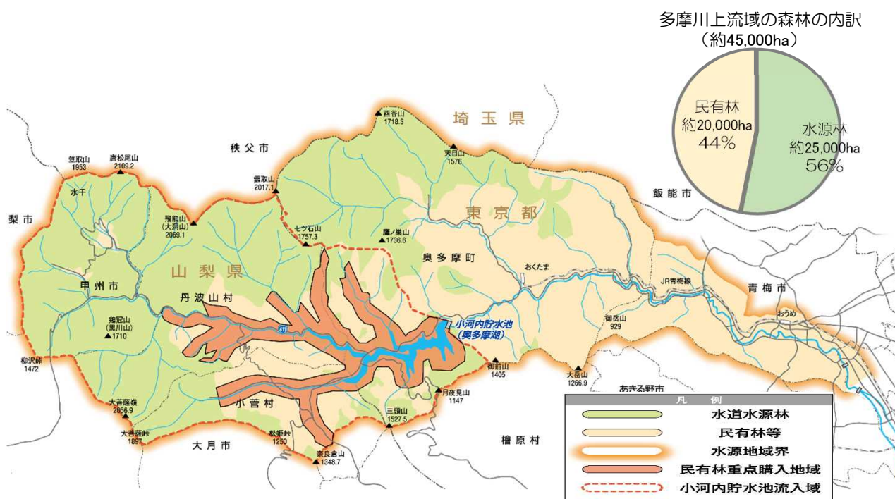
多摩川上流域位置図

一方、残る約20,000ヘクタールの民有林は、手入れが行き届かない森林が増加し、土砂流出による小河内貯水池への影響が懸念されるなど、早急な対策が必要となっています。