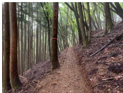
整備後の森林 (歩道の整備や間伐などを実施)