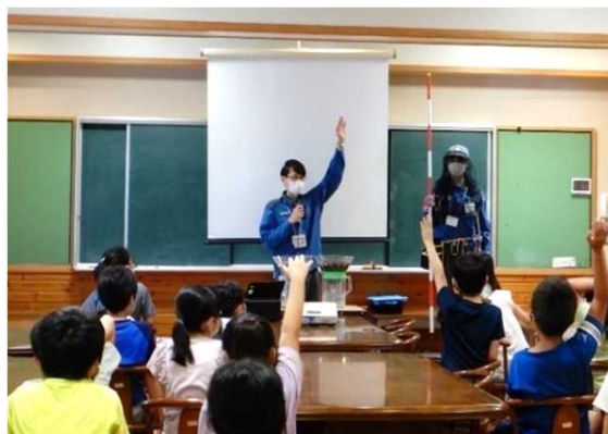
小学校での水道教室