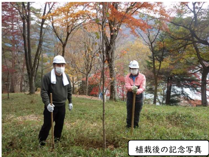
植栽後の記念写真

景色もよく、水源林と奥多摩湖が良く見えたので森と水の関わりを感じていただけました。クワを使うのが初めての方もいましたが、指導員の補助もあるので安心です。