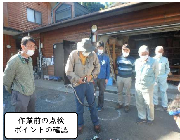
作業前の点検 ポイントの確認