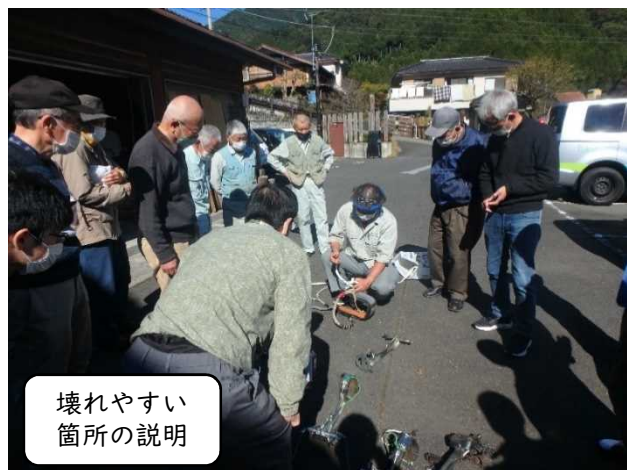
壊れやすい 箇所の説明

また、枝打作業で木に登るために足に付けて使う登降機の点検方法を学び、実際に壊れた登降機を見ることで作業前の安全確認のポイントを身に付けました。