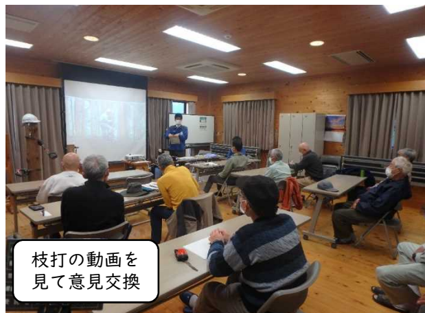
枝打の動画を 見て意見交換

午後は、事前に撮影しておいた参加者の枝打作業の映像を見て、良いところや改善点などの意見交換を行いました。思わぬ癖や間違った手順が見つかることもあったので、各自の作業方法を見直す良い機会となりました。